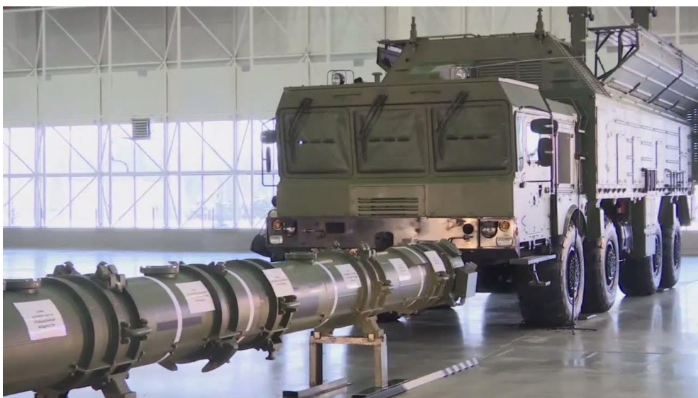
Fig. 2 – Um contentor do míssil de cruzeiro de lançamento terrestre móvel com alcance intermédio 9M729 (SSC-8) seguido de um possível Transporter-Erector-Launcher .

O míssil empregará um sistema de guiamento produzido pelo gabinete GosNIPP, sendo notado pela fonte que o seu Transporter-Erector-Launcher é semelhante ao do míssil Iskander-M (veículo 9P78-1), compatível com o INF, o que, a ser verdade, dificultará eventuais atividades futuras de controlo de armamentos. Alguns analistas referem que aquele veículo será antes o 9P701.